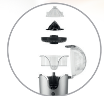
Completamente smontabile per una facile pulizia