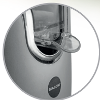
Beccuccio con sistema salvagoccia