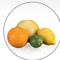
Spreme agrumi di qualsiasi dimensione