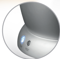
Tasti funzione con luce LED